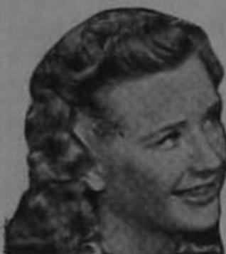
Priscilla Lane de la Warner Bros

LA cara, los brazos y las manos adquieren un aspecto fresco y encantador aplicando Crema Primavera antes de empolvarse. Véalo en su espejo. El cutis marchito y macilento se esfuma y aparece la piel rosada y transparente que es tan atractiva y tan admirada.