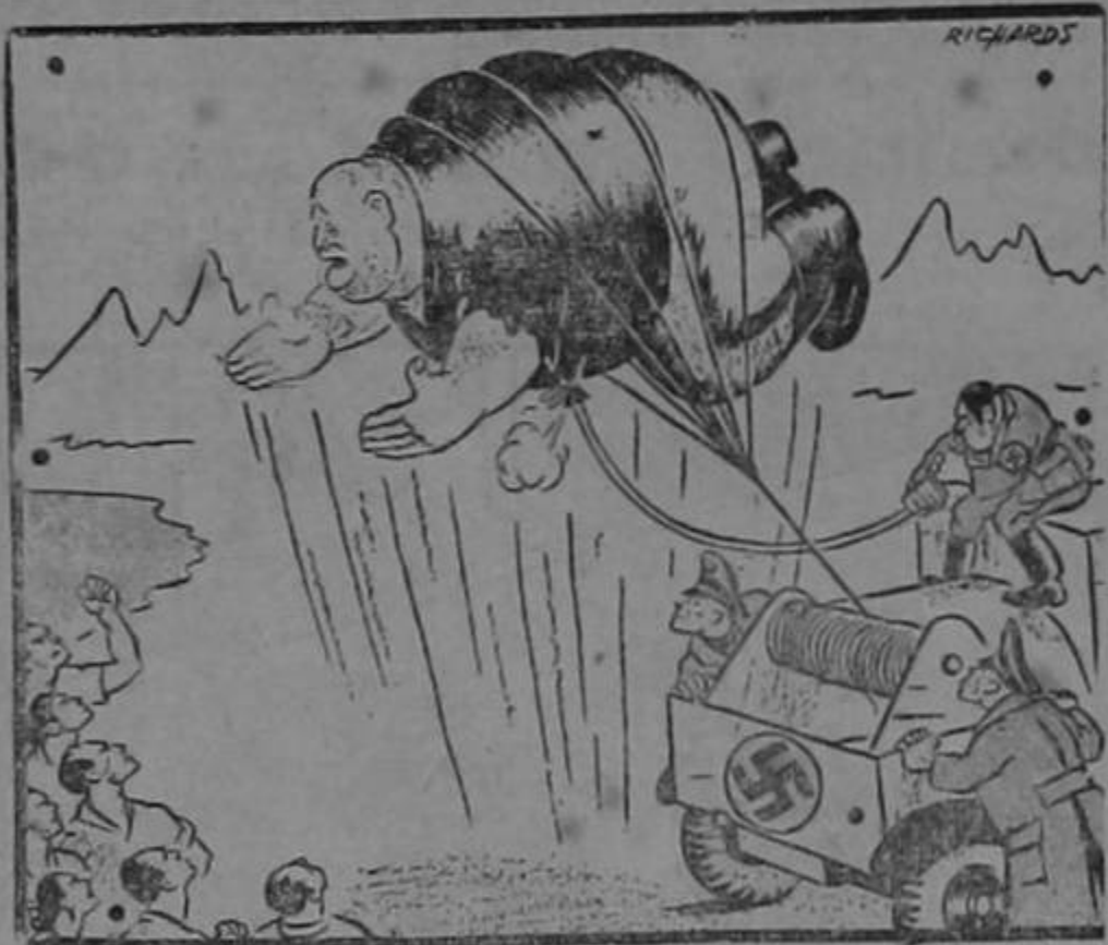
"He vuelto a asumir la dirección suprema del fascismo en Italia..." Mussolini, 15 Sept. 1943.