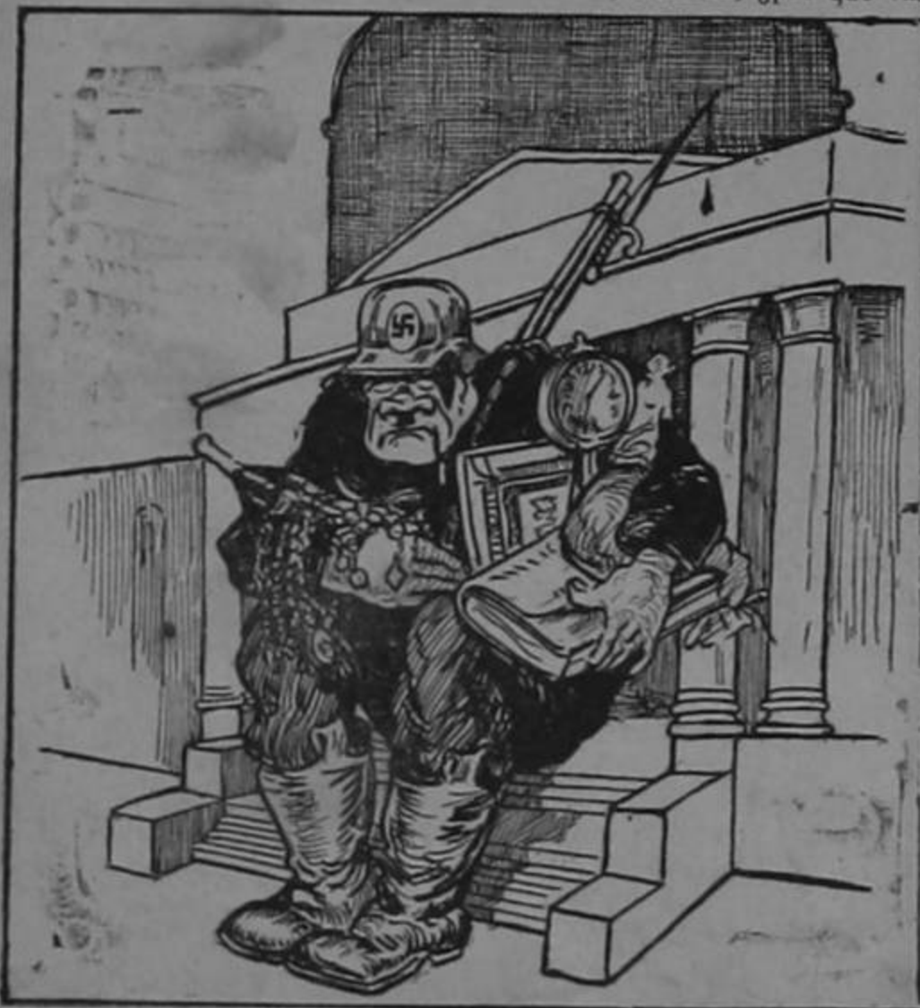
La cultura nazi, protectora del Vaticano!

Hitler: —No os preocupéis, muchachos, yo os lo arregaré todo.