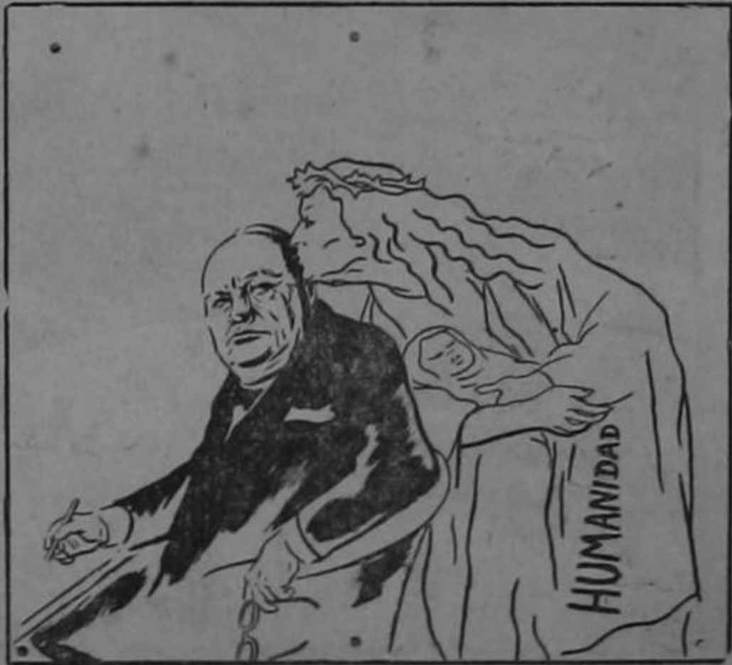
GRACIAS, MR. CHURCHILL