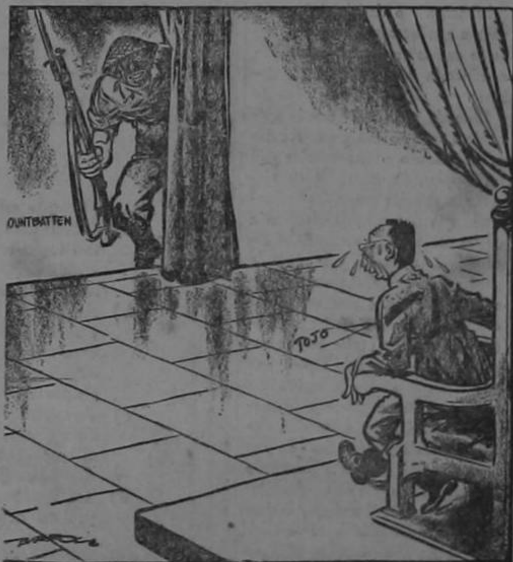
Anunciando a Lord Mountbatten, nuevo Comandante Aliado del Pacífico Sur.

A las 7 y a las 9. LA FUERZA DEL MAL Pronto, pronto, pronto. (Por Brenes Mesón).